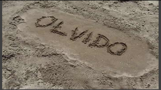
Olvido de arena , 2007. Parte de la colección del MOLAA, La galería Gabriela Mistral (Chile), Universidad Nacional de Colombia.

“Bahía Inútil” es el lugar en el fin del mundo, donde los mares se encuentran, la tierra termina y los hombres aparecen como acordes en el viento. Se trata de acciones poéticas que evocan la memoria del fin del mundo, testigo de las dictaduras del Sur.