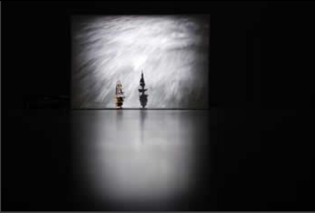
Expulsión del Paraíso , Premio Luis Caballero